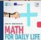
Lituania - Joniskis