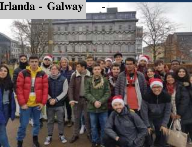
Irlanda - Galway