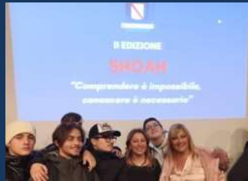
PER NON DIMENTICARE