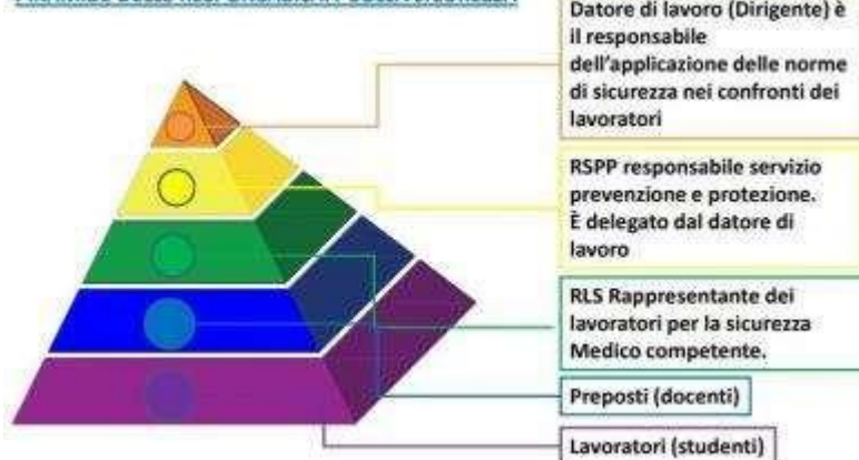
PIRAMIDE DELLE RESPONSABILITÀ SULLA SICUREZZA